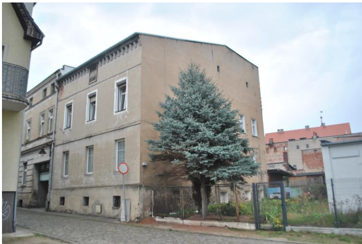
Dom, widok od SE