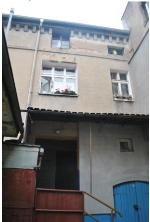
Dom, widok od NW