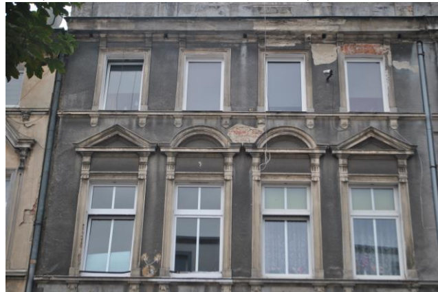
Dom, widok od E