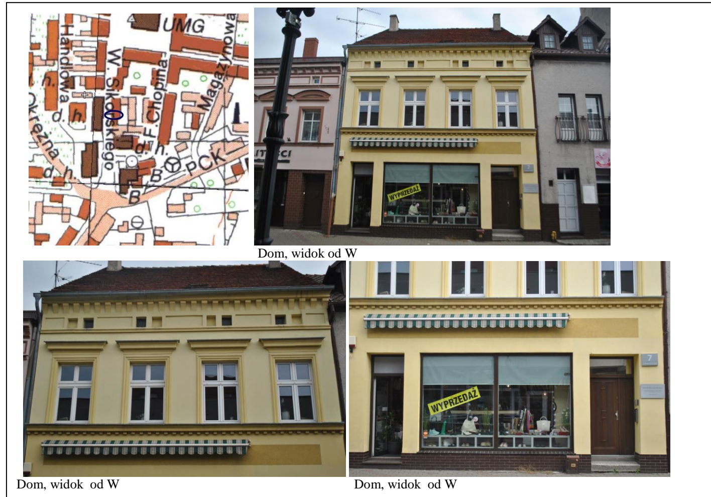
Dom, widok od W