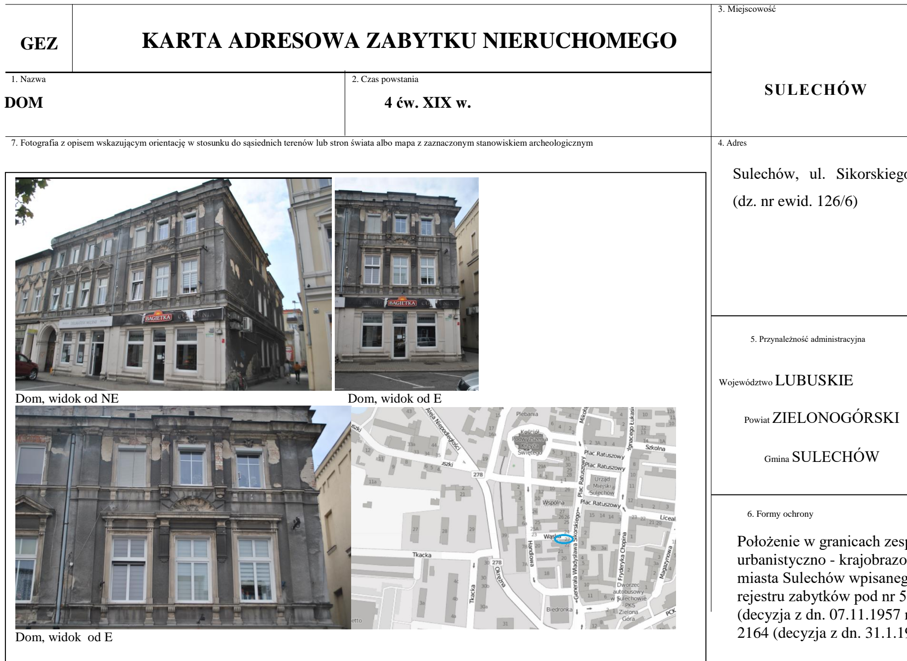
Dom, widok od NE