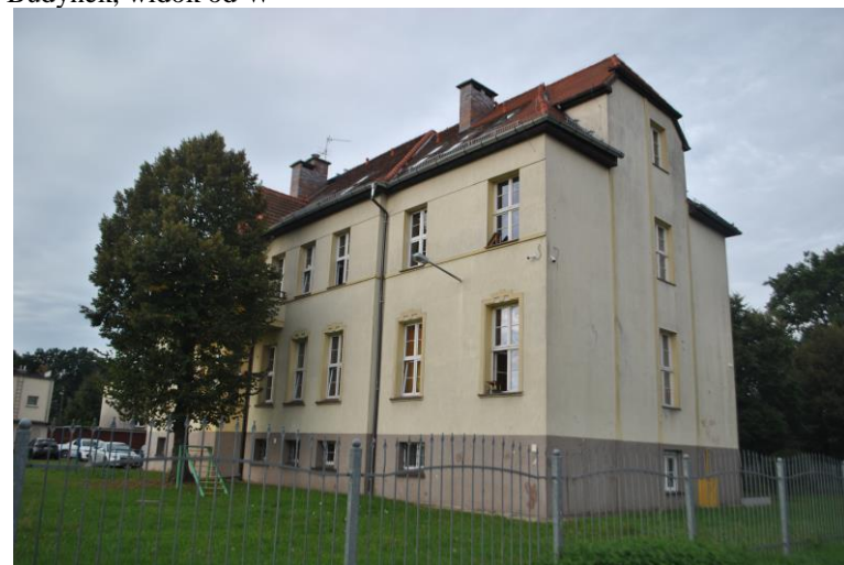
Budynek, widok od SE

5. Przynależność administracyjna Województwo LUBUSKIE Powiat ZIELONOGÓRSKI Gmina SULECHÓW