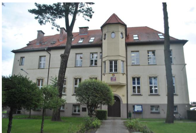
Budynek, widok od W

4. Adres Sulechów, ul. Łączna 1 (dz. nr ewid. 472/2)