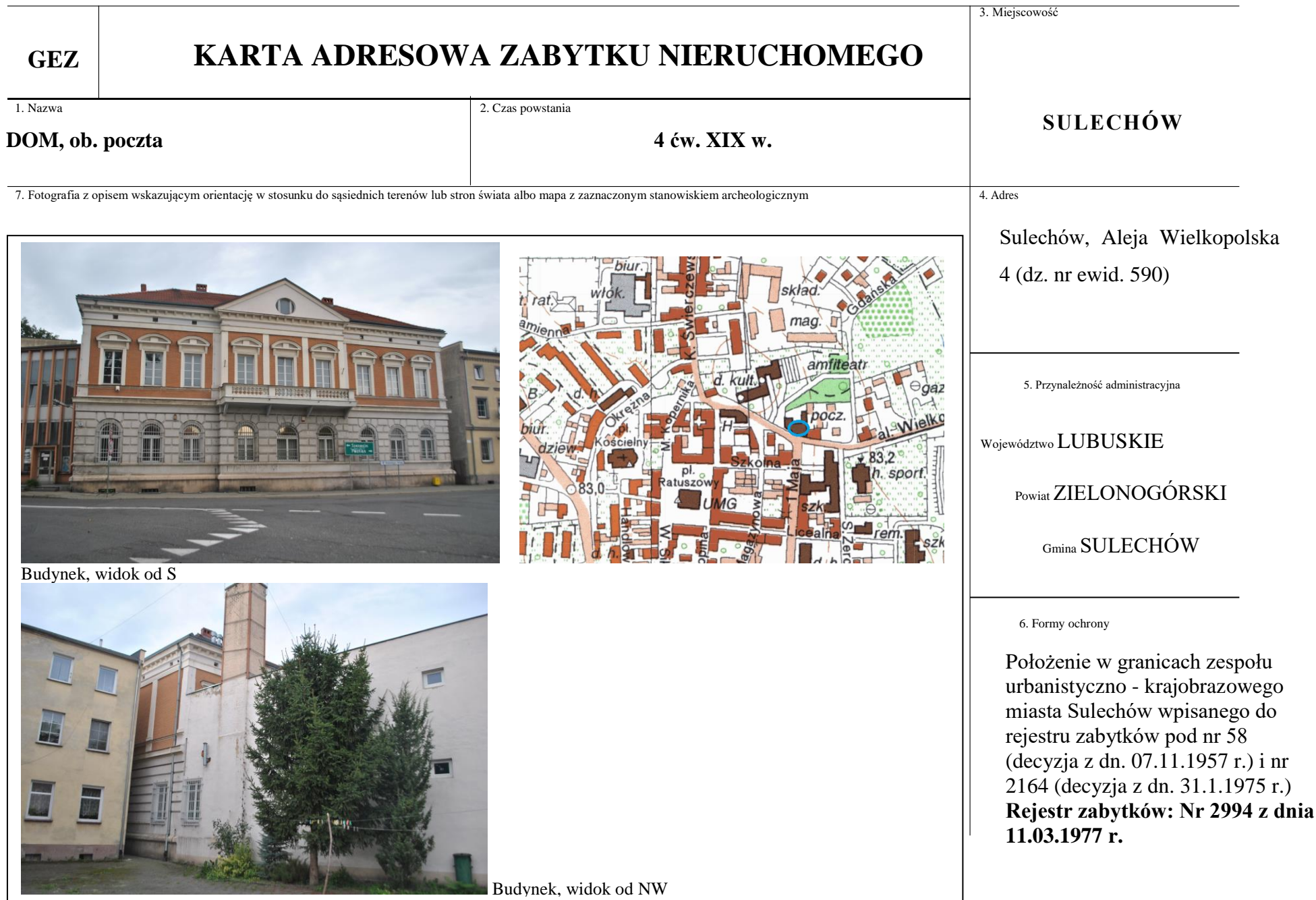
Budynek, widok od S