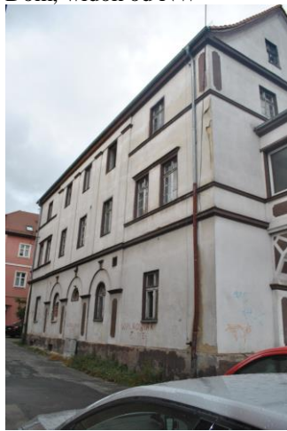
Dom, widok od E

5. Przynależność administracyjna Województwo LUBUSKIE Powiat ZIELONOGÓRSKI Gmina SULECHÓW