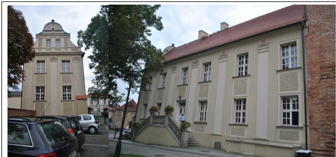
Budynek, widok od SE

Położenie w granicach zespołu urbanistyczno-krajobrazowego miasta Sulechów wpisanego do rejestru zabytków pod nr 58 (decyzja z dn. 07.11.19957r.) i nr 2164 (decyzja z dn. 31.01.1975r.) Rejestr zabytków: Nr 548 z dnia 30.05.1963 r.