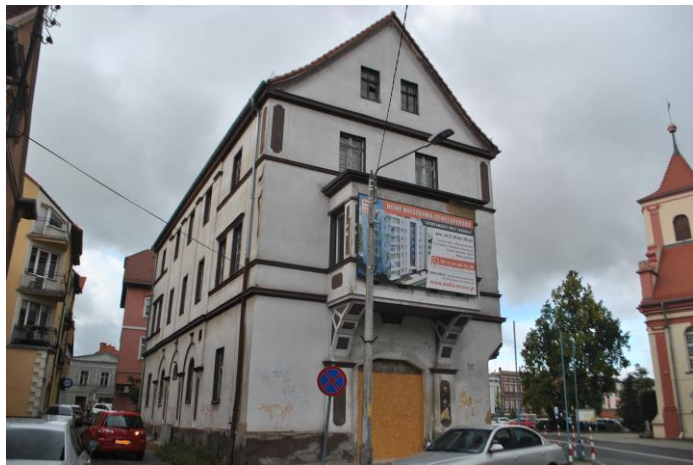
Dom, widok od NW

4. Adres Sulechów, Aleja Wielkopolska 12 (dz. nr ewid. 236/7)