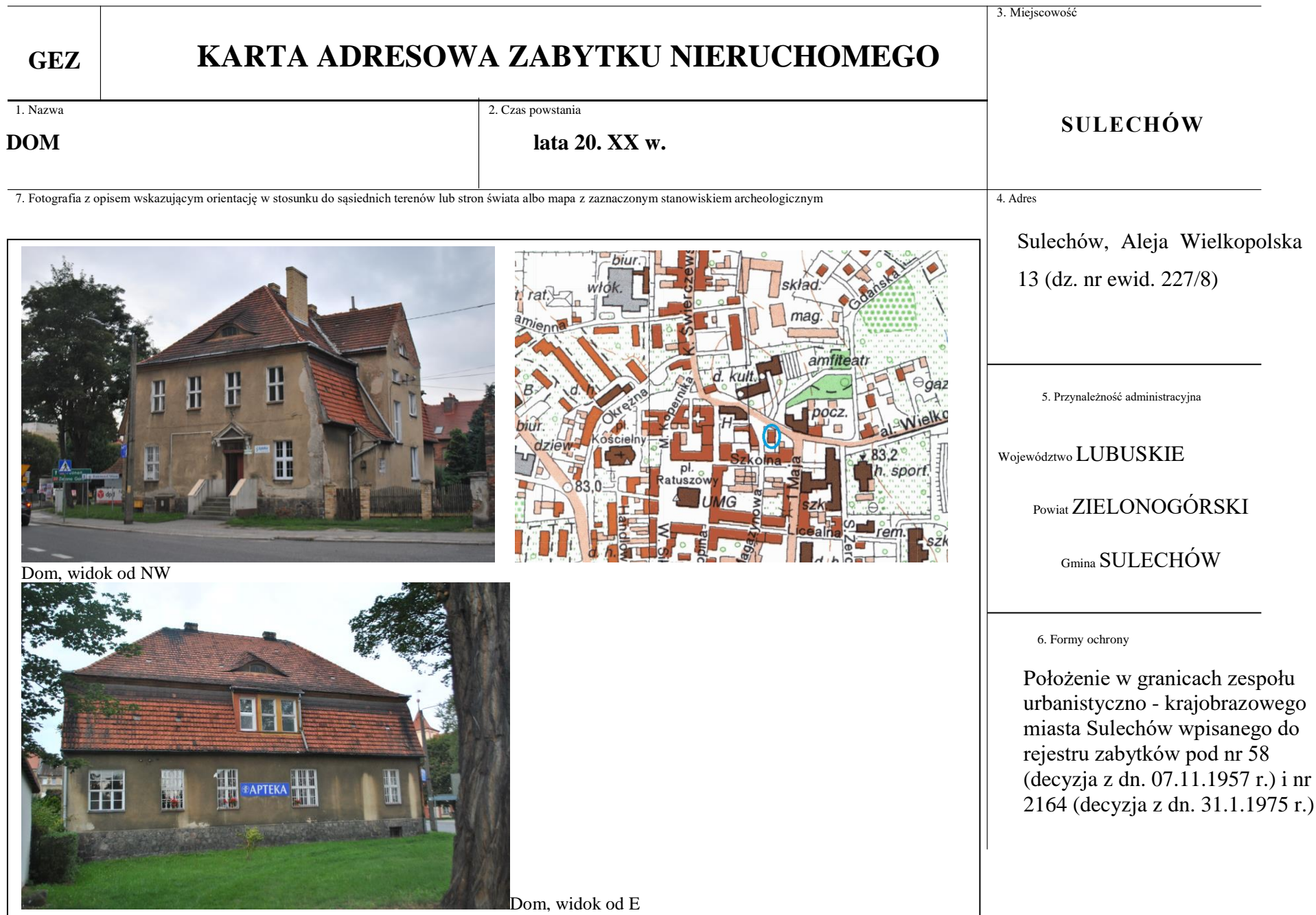
Dom, widok od NW