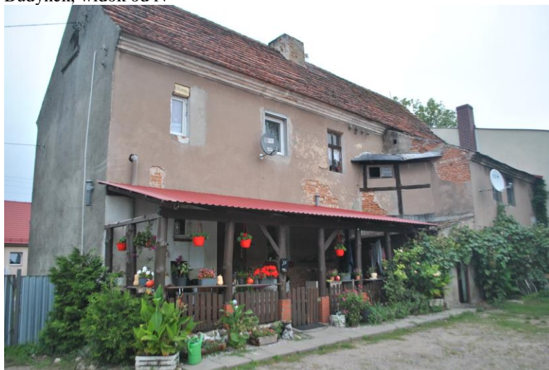
Budynek, widok od SW