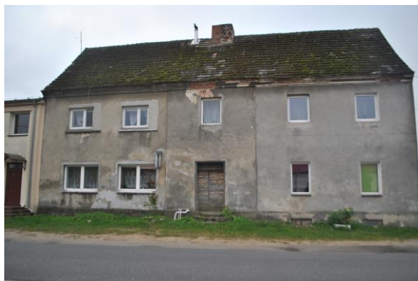
Budynek, widok od N