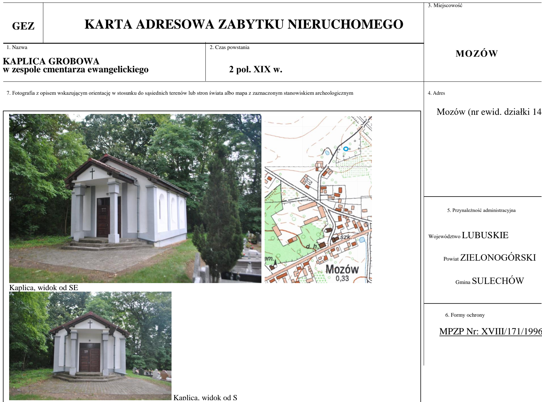
Kaplica, widok od SE