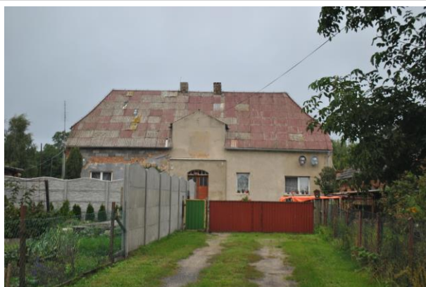
Budynek, widok od SW