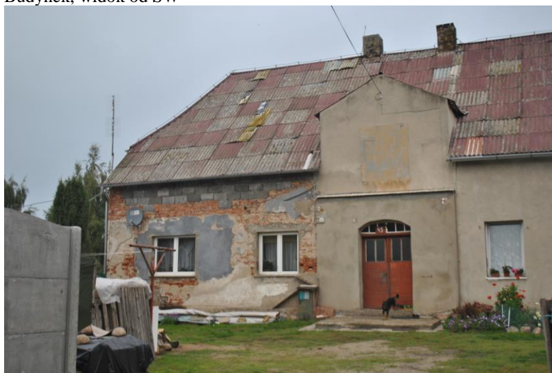
Budvnek. widok od S