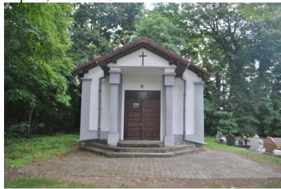
Kaplica, widok od S