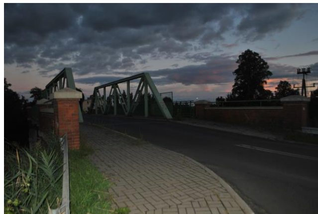
Wiadukt, widok od NW