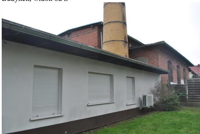
Budynek, widok od N