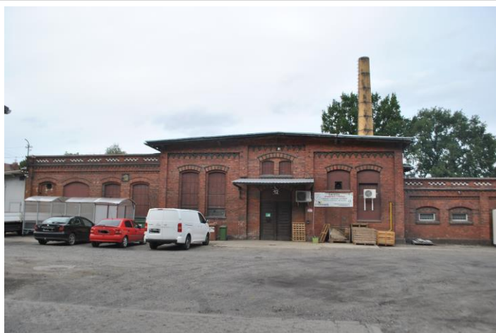
Budynek, widok od S

Sulechów, ul. Przemysłowa (dz. nr ewid. 256/3)