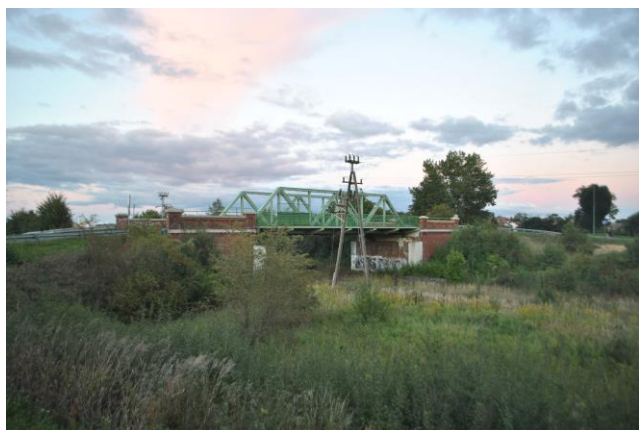
Wiadukt, widok od SW