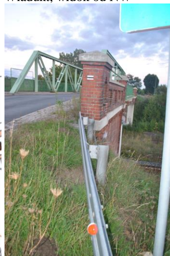
Wiadukt, widok od SE

Sulechów, ul. Przemysłowa (dz. nr ewid. 7/32)