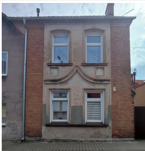
Budynek, widok od S

4. Adres Sulechów, ul. Wolności 2a (dz. nr ewid. 428/14) Uwaga – w gison Sulechów posiada wspólny nr 2 z budynkiem obok.