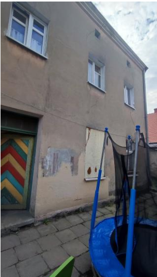
Budynek, widok od N