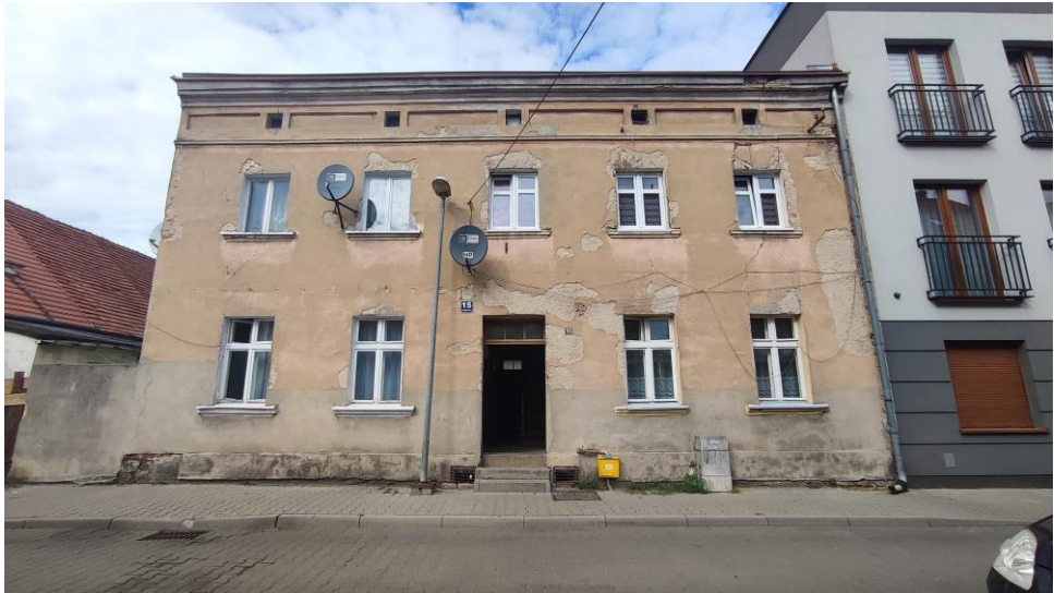
Budynek, widok od S