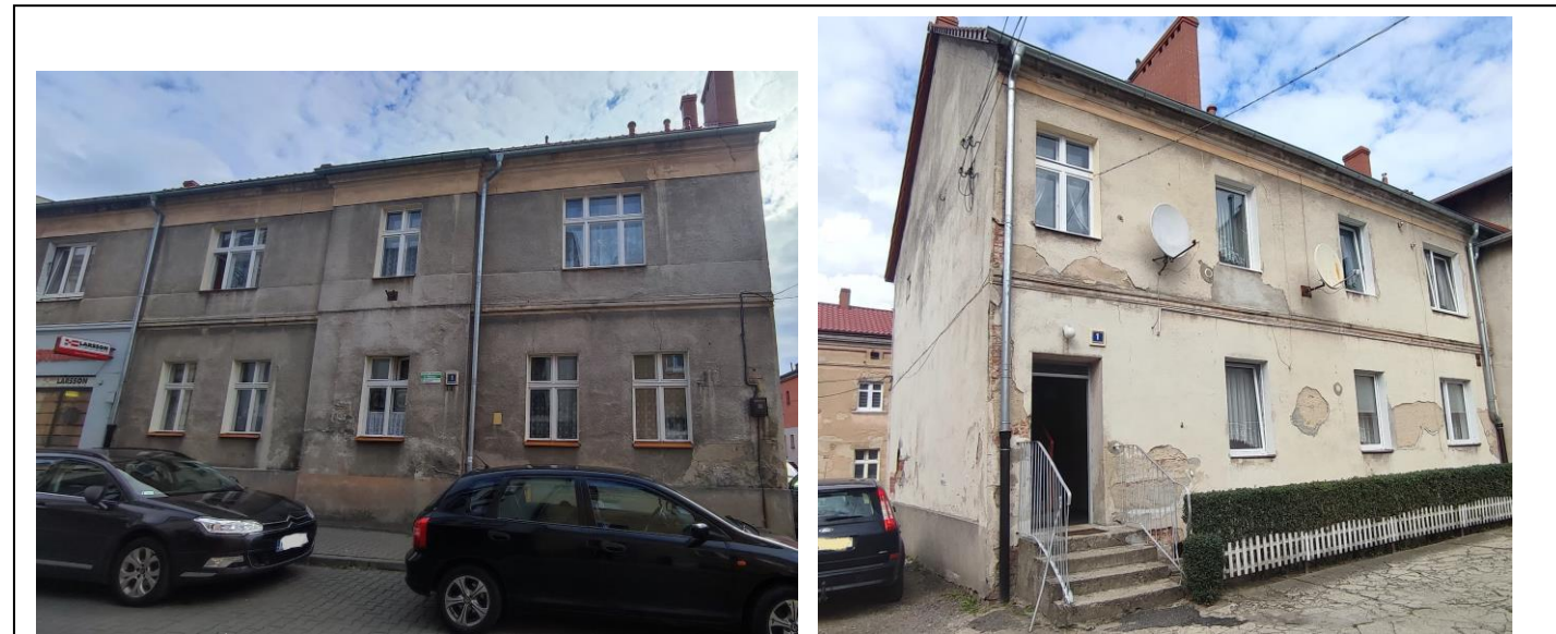
Budynek, widok od N