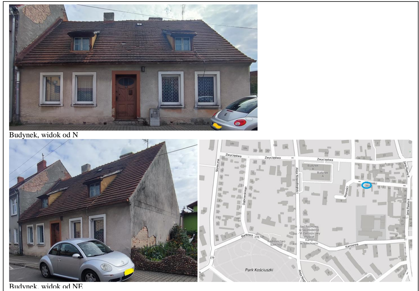
Budynek, widok od N

7. Fotografia z opisem wskazującym orientację w stosunku do sąsiednich terenów lub stron świata albo mapa z zaznaczonym stanowiskiem archeologicznym