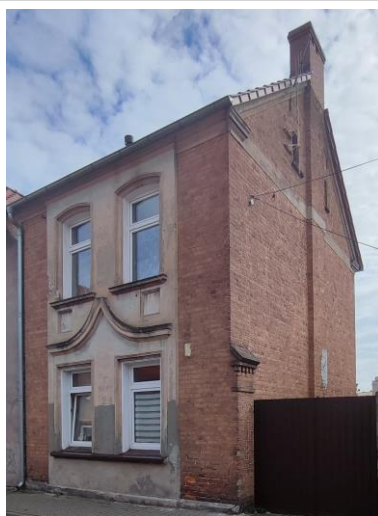
Budynek, widok od S