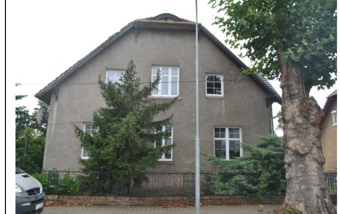
Dom, widok od E