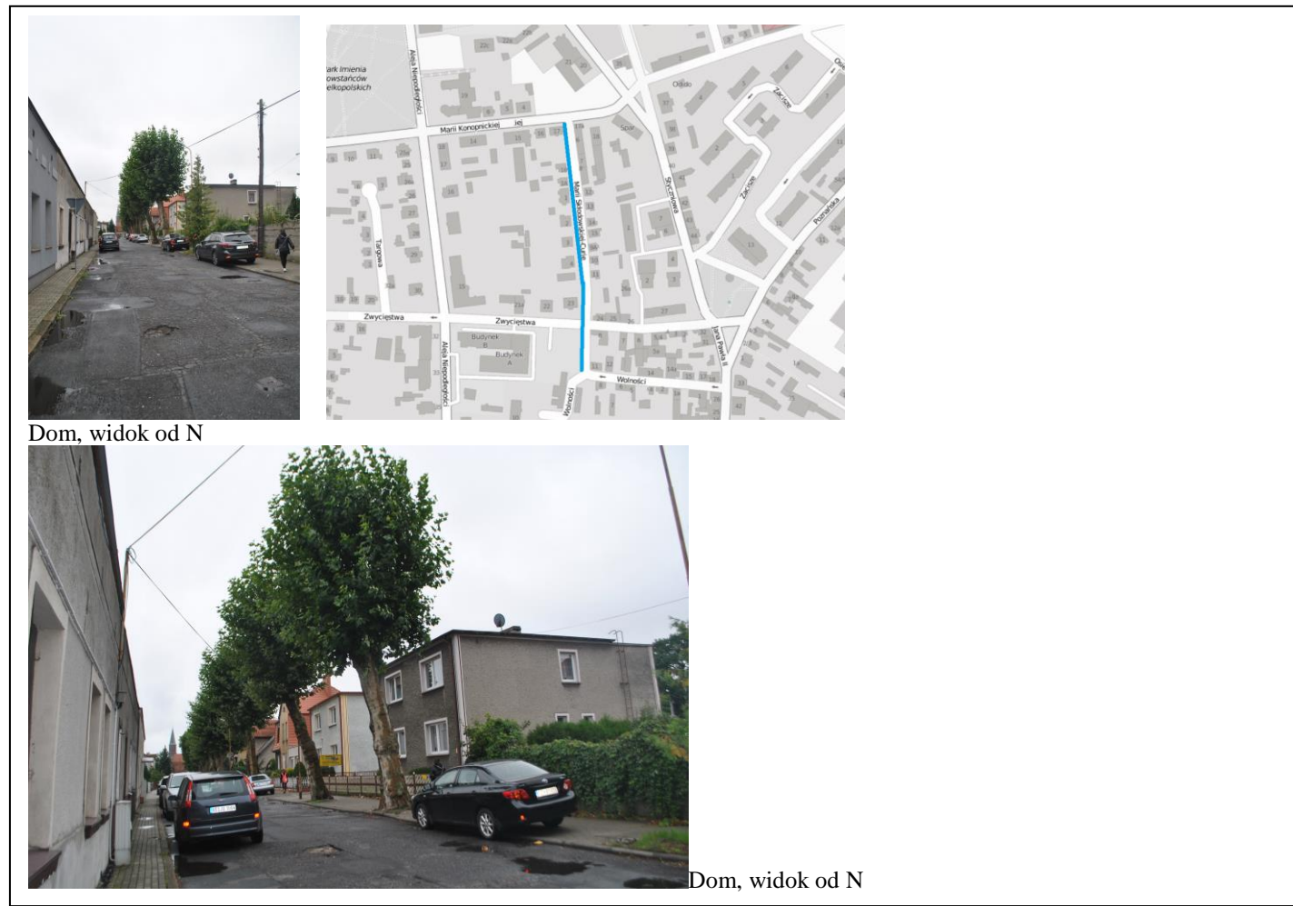
Dom, widok od N