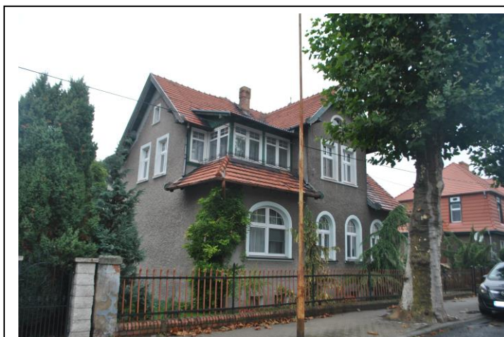
Dom, widok od SE

Sulechów, ul. Skłodowskiej 2 (dz. nr ewid. 380)