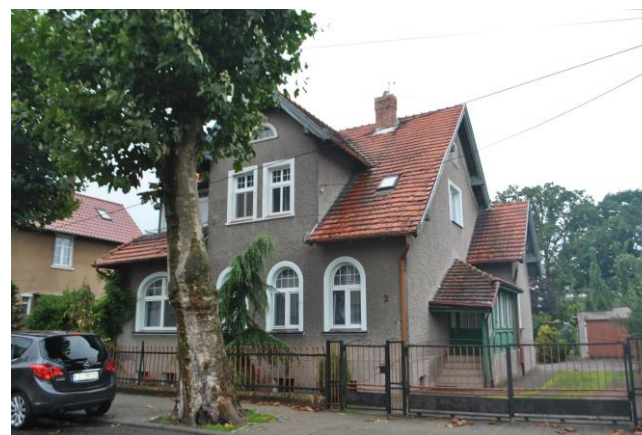
Dom, widok od NE