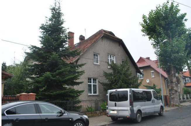
Dom, widok od SE

6. Formy ochrony Położenie w granicach zespołu urbanistyczno-krajobrazowego miasta Sulechów wpisanego do rejestru zabytków pod nr 58 (decyzja z dn. 07.11.19957r.) i nr 2164 (decyzja z dn. 31.01.1975r.)