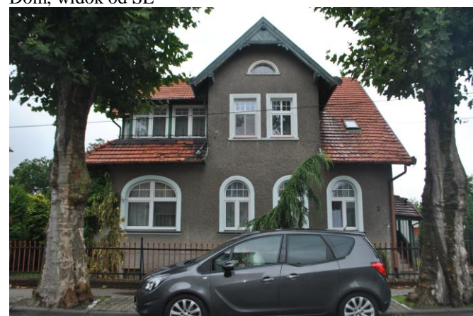
Dom, widok od E