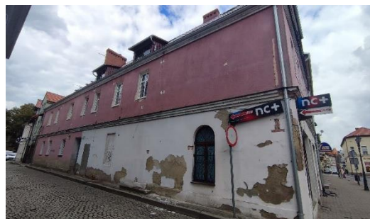
Dom, widok od S

Sulechów, ul. Brama Piastowska 1 (dz. nr ewid. 177/2)