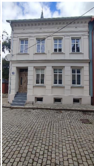
Dom, widok od S