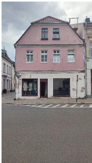
Dom, widok od E