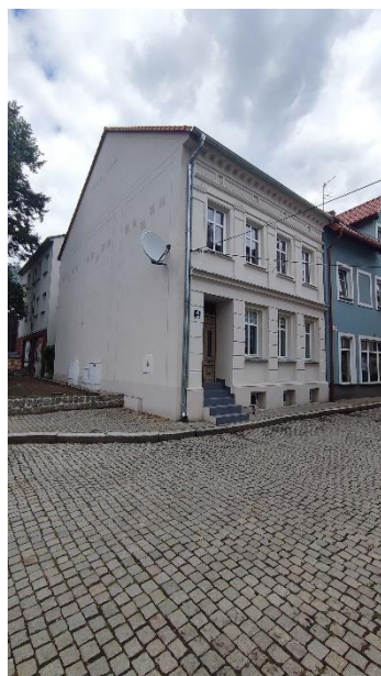
Dom, widok od SW

Sulechów, ul. Brama Piastowska 4 (dz. nr ewid. 177/16)