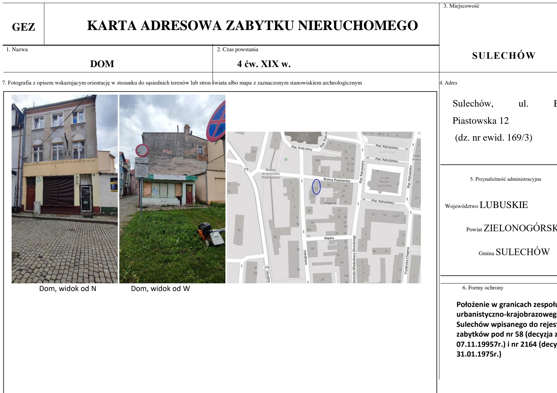
Dom, widok od N