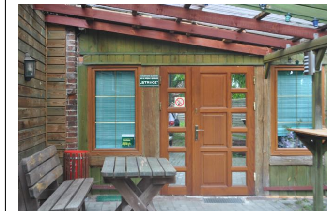
Wejście , widok od W