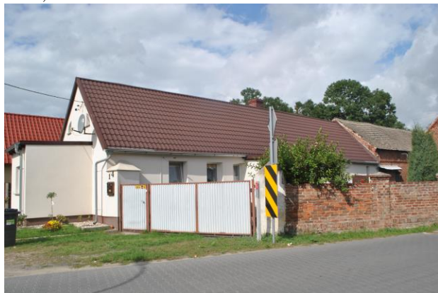
Dom, widok .od E