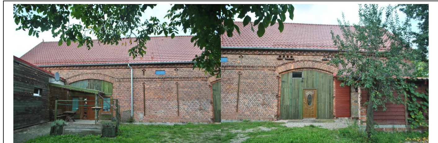
Budynek widok od W

7. Fotografia z opisem wskazującym orientację w stosunku do sąsiednich terenów lub stron świata albo mapa z zaznaczonym stanowiskiem archeologicznym 4. Adres Obłotne 8a (dz. nr ewid.101/7)