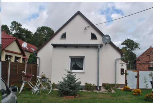
Dom, widok . od S