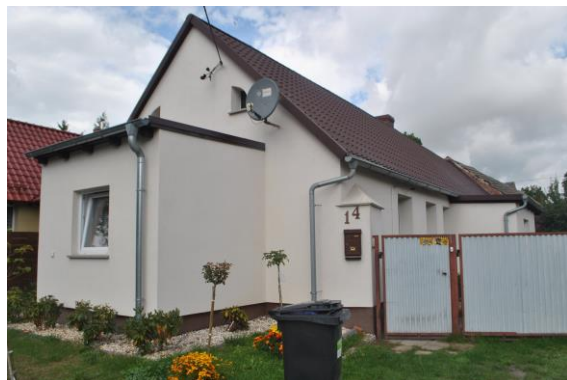
Dom, widok . od SE