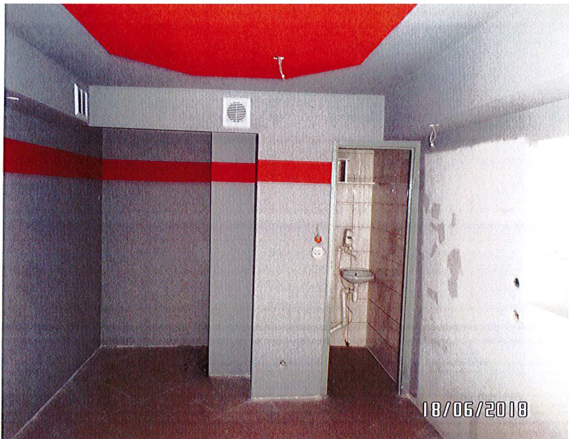
ZDJĘCIA LOKALU MIESZKALNEGO PRZY UL. JANA PAWŁA II nr 15/1: