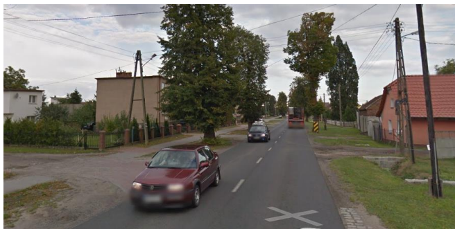
POCZĄTEK: Kruszyna skrzyżowanie z ul. Skowronkową